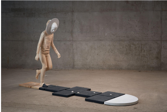
Willy Verginer, 〈Rayuela (Moongirl)〉, 菩提木、丙烯顏料, 156 x 292 x 82 cm, 2019

為開啟藝術展會與畫廊、藝術家的合作新模式，「Voices」特此與曾旅居歐陸近十五年、具歐洲現代與當代藝術史背景的資深策展人王焜生 (Emerson Wang) 合作，並透過策展人居中協調場地與作品的展出方式，以及整體空間的觀賞效果，佐以透過清晰論述脈絡，標示出藝術展陳的新方向，亦期待藝術家以對空間的思考，呈現更完整的創作概念。