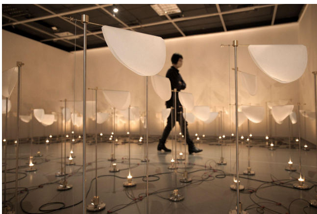
王仲堃,〈場〉, 不銹鋼、黃銅、電子設備、合成紙, 高63-103cm、數量依場地而定, 2022

第三個主題「隱現之間」(Between Visible and Invisible)，針對見與不見之間的邊緣展開討論：王仲堃從觀看氣象的風向圖，組織為視覺化的統計，密集的箭頭作為裝置的焦點，一個風場的機械裝置，敲起風的鈴聲；謝榕蔚在平面繪畫裡創造出屬於場域特性的裝置空間，挪用現場自然光源，製造出我們極常忽略的光與繪畫交會的剎那；洪郁雯將傳統編織幻化為繽紛雕塑，打破材質的限制，創造出有機性的雕塑，此次將是對藝術家的空間挑戰，如何在一個現實的物理性空間，展現虛幻抽象的心理狀態。