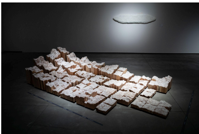
水谷篤司, 〈幻影風景〉, 木、水性日本畫顏料、壓克力顏料, 70 x 280 x 380 cm, 2022

「Voices」的展出內容，由人類處境與環境議題相關議題為旨的「地球生活」(The Planetary Living)開啟，包括義大利雕塑家Willy Verginer 深具人文永續關懷的人間實相；黃贊倫大型裝置雕塑人獸之間的界線跨越，生物科技的衝擊，引領觀眾思考人類生存的意義；水谷篤司透過特殊地域木質創作出起伏的山脈，暗喻人類對於自然奧秘的未知所產生的疑惑與探索；加藤智大以紅氧化鐵製造出人像繪畫以及身體雕塑，重新探討社會的既定觀點，打破既有框架，反省人在環境中的意義。